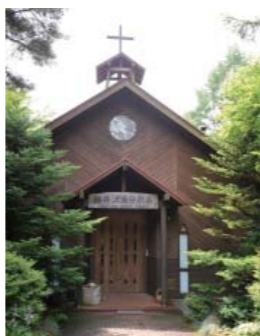
温水路の近くに建つ軽井沢追分教会。趣ある素朴な佇まい。

森を抜けると、突如目の前に開ける明るい水辺。御影用水の温水路と呼ばれるこの農業用水路は、浅間山の冷たい水を温めて水田に供給するためのもの。まるでヨーロッパの田舎のようなどかな風景が続き、思わず立ち止まって見とれてしまうほど。温水路に沿って続く脇道は野に咲く花と緑に彩られ、愛犬とのんびり散歩するにもぴったり。地元の犬たちにも人気です。