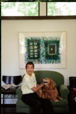
お気に入りのソファでくつろぐグリーン。大好きなご主人と。