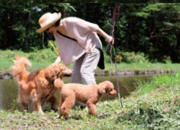
温水路は大たちの大好きなスポット。水辺で犬はしゃぎ！