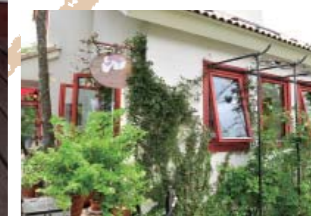
ガーデンの草木が楽しいテラス席。ケーキやタルトには信州の旬の果物がたっぷり。