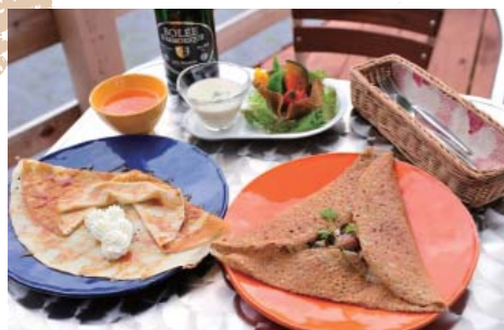
浅間山を一望するテラス席。好きなガレット・クレープが選べるランチセット(スープとサラダ付き)は1500円。