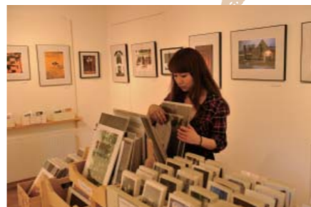
お気に入りのポストカードをお土産に。