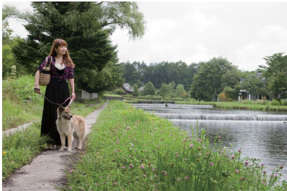
幅 20m の浅い温水路に水をゆっくり流すことで、水温が上がるのだそう。美しい景色は歩くだけでも贅沢な気分!