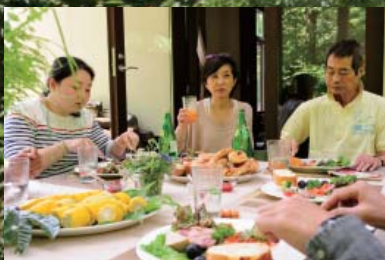
ご近所のお友達を誘って賑やかなランチタイム。みずみずしい高原野菜が最高のごちそうです。