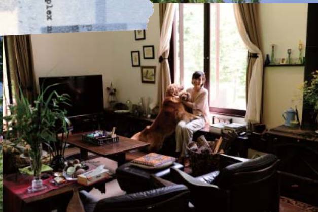
高い天井と大きな窓が開放的なリビング。人も犬も思い思いにくついで。