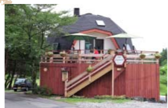
設計から建築まで3年をかけ、オーナーがひとりで(!)建てたドームハウス。

●長野県北佐久郡御代田町御代田 4108-1902 / 月~木 10:00 ~ 18:00 (金土日は 19:00 まで営業) / 不定休