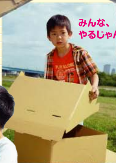
みんな、やるじゃん...