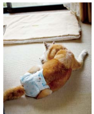
認知症になり、おしめが欠かせなくなったチビちゃん。藤野家の飼い犬6頭のなかでは、もちろん最年長