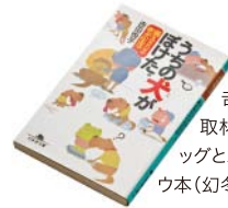
『うちの犬(こ)がぼけた。〜備えあればの老犬生活』 吉田悦子さんが自身の体験と取材を元に書き上げた、シニアドッグとハッピーに暮らすためのノウハウ本(幻冬舎 わんこ文庫・533円+税)