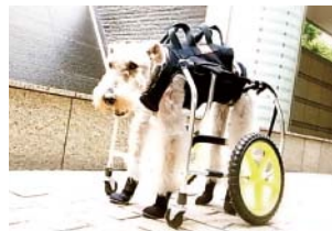
車イスに乗ると得意満面になったエフくん

そんな介護生活が数カ月過ぎたころ、 エフは14歳の誕生日が目前に迫った 2009年7月14日に亡くなってしま